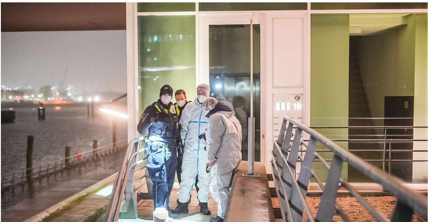
Die Polizei sicherte am Tatort Spuren.

Nachdem ein Restaurantbetreiber von zwei Unbekannten in seinem Treppenhaus schwer verletzt und ausgeraubt wurde, setzt der Mann nun ein Kopfgeld aus.